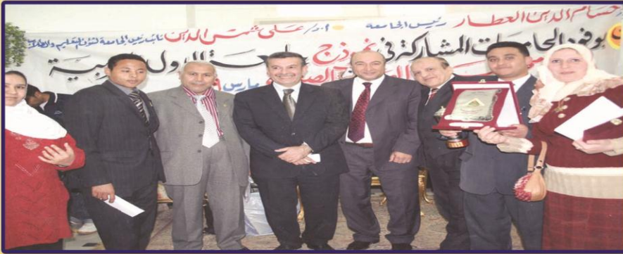
جامعة بنها نموذج مصر لجامعة الدول العربية