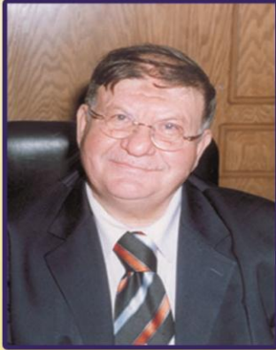
الطار يشارك طلاب اداب بنها الموسم الثقافي