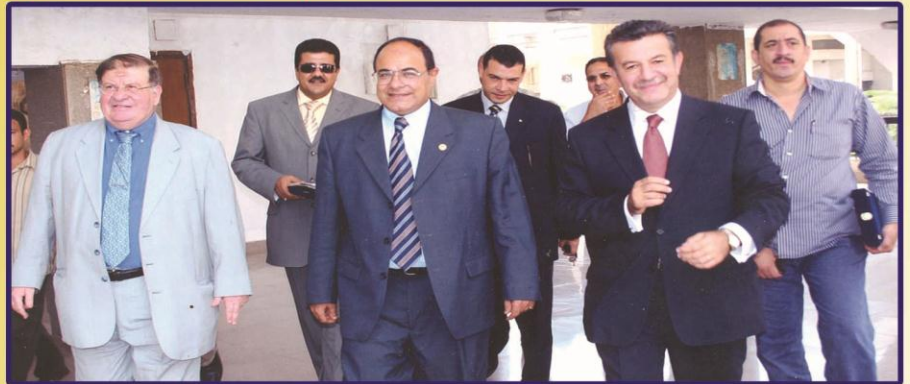
جامعة بنها تكتفل بذكرى انتصار اكتوبر