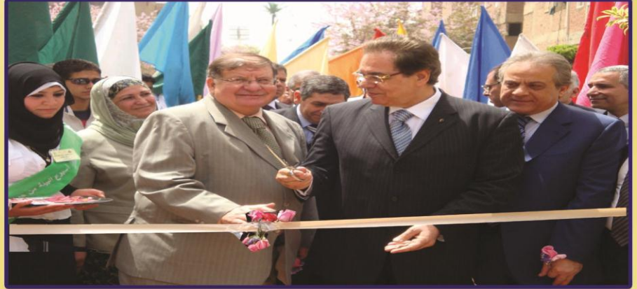
المستشار / عدلي حسين يفتتح الاسبوع الإقليمي الرابع بجامعة بنها