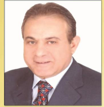
ا.د/ صفوة زهران رئيس لجامعة بنها