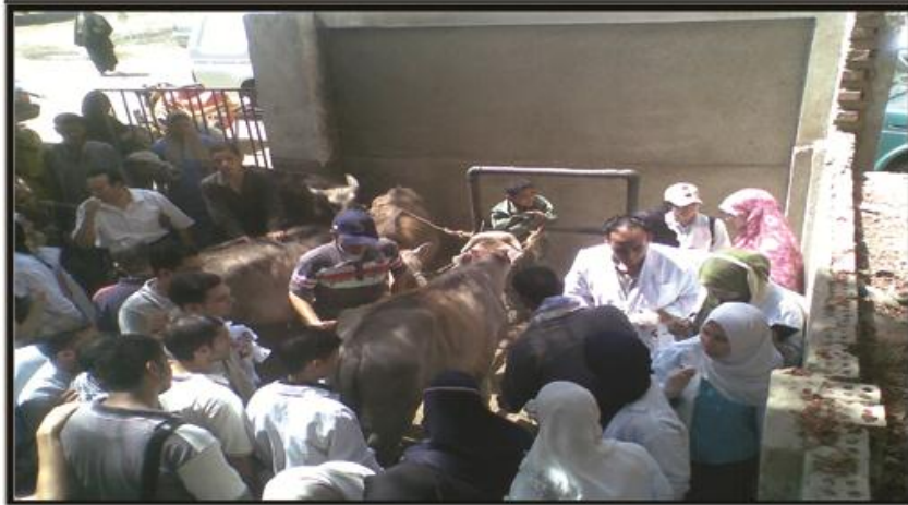
القافلة البيطرية أثناء فحصها بعض الحالات في قرية مشتهر .